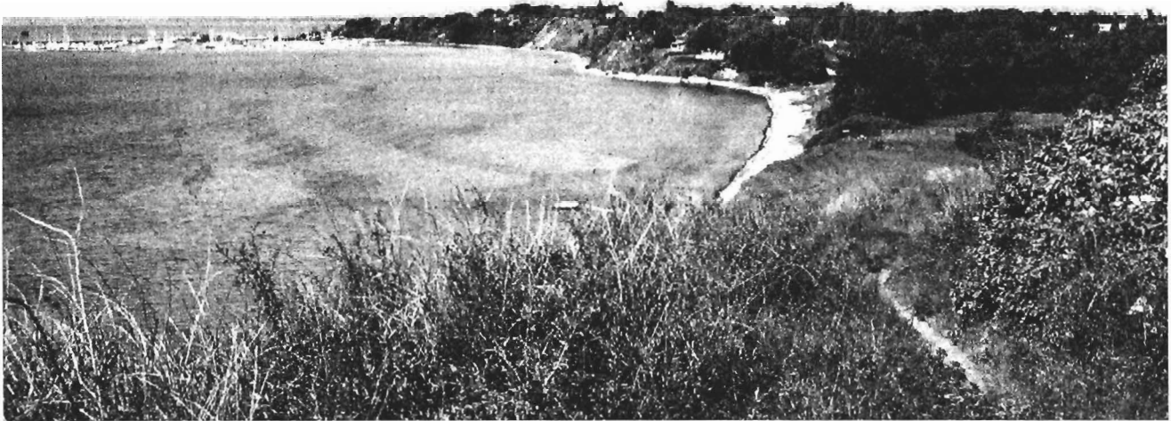
Fig. 136. Lynæspladsen beliggende ved sandstranden midt i billedet mellem Klintebakke og Skuldeklint. Set mod vest fra Klintebakke.

mellem slutningen af 2. årh. e.Kr. og begyndelsen af 12. årh. Det står dog fast, at Lundeberg er den eneste lokalitet, der med sikkerhed har eksisteret før midten af 6. årh., mens de øvrige først dukker op herefter. Som det blev nævnt i kapitel 5.3.3. er der på flere af pladserne fra 6.-12. årh. i Roskilde Fjord fundet enkelte genstande fra perioden 200-520/30 e.Kr., og det forhold gentager sig på lokaliteterne Stubberup, Vester Egesborg, Sebbesund og Baes Banke. Hvorvidt de sparsomme spor i realiteten hidrører fra yngre romertids og ældre germanertids anløbspladser er endnu et åbent spørgsmål. Et er imidlertid sikkert: de mulige pladser fra 200-520/30 e.Kr. har i så fald et ganske anderledes arkæologisk udtryk end i perioden 520/30 til 1100 e.Kr., og dermed har der, i hvert fald delvist, været forskel på virksomheden i de to faser. Set i forhold til Lundeberg synes andre fund under ingen omstændigheder af meget. 1